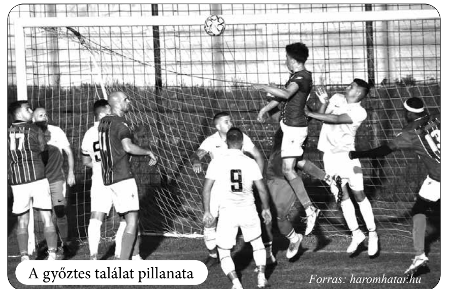
A győztes találat pillanata