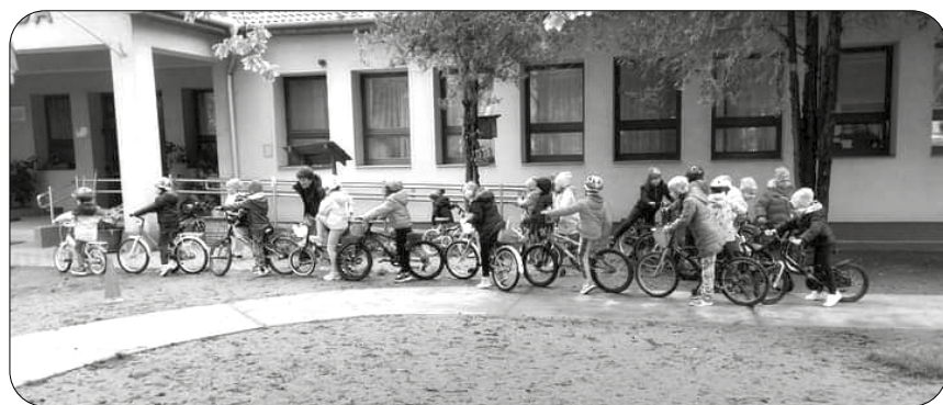
Földről az óvó nénik segítségével, játékos vetélkedőkön vettek részt, ügyességi –