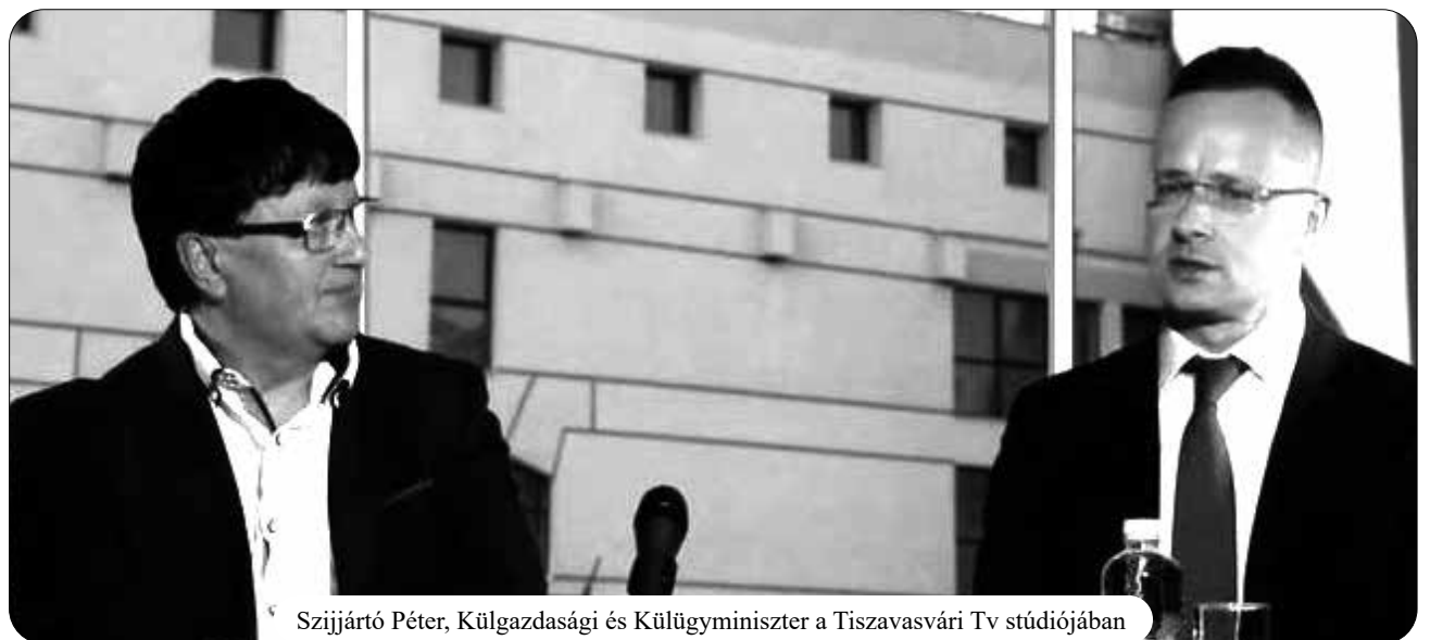
Szijjártó Péter, Külgazdasági és Külügyminiszter a Tiszavasvári Tv stúdiójában