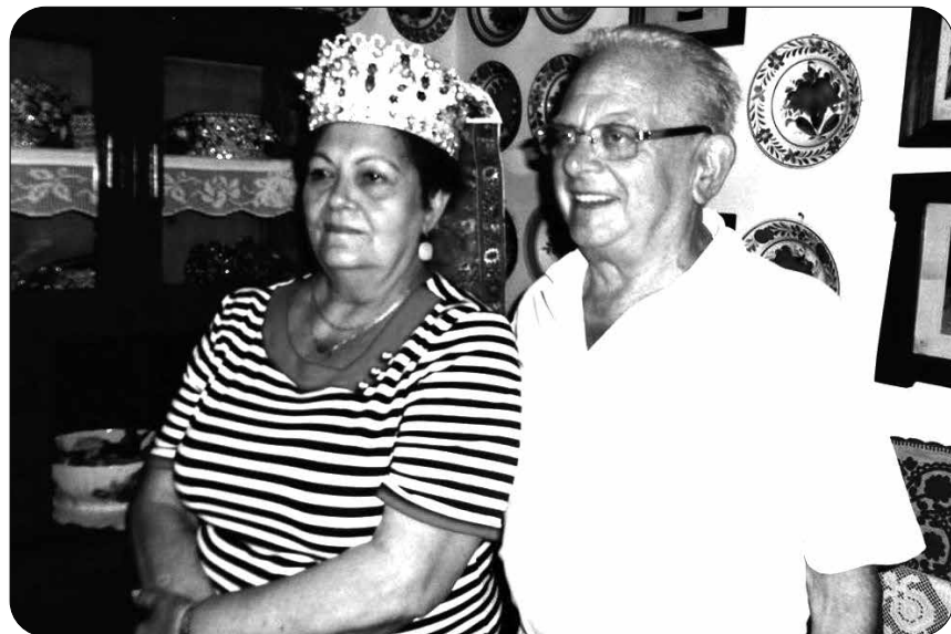
a Kép a Vasvári Pál Társaság Körösfői kirándulásán készült