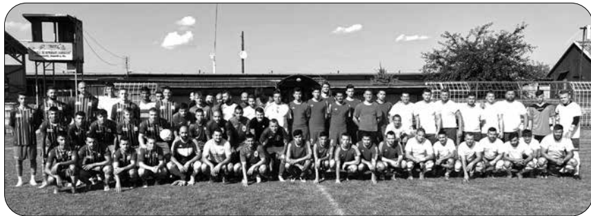
Rakamaz, Tiszavasvári, Tiszalök és Ibrány csapatai a Bohács Sándor emléktornán