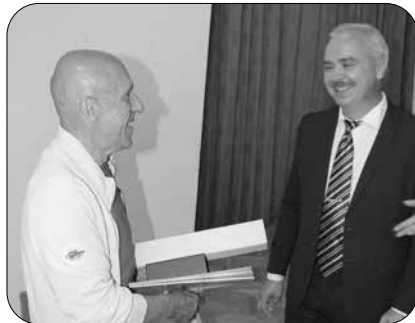
Köszönjük az egészségügyben dolgozók áldozatos munkáját!