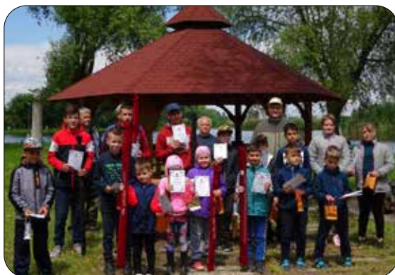
A Gyermeknapi horgászverseny résztvevői