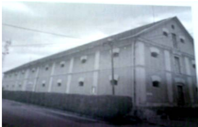
Tiszavasvári Város Önkormányzata Tiszavasvári, Városháza tér 4.